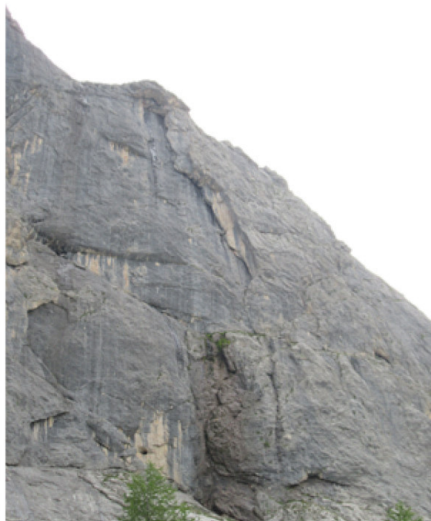
Il diedrone con il tetto finale.